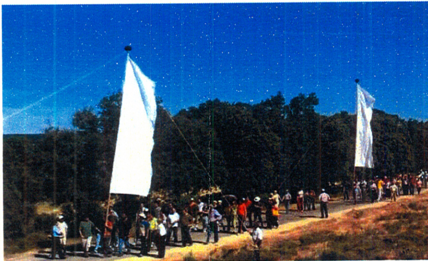
Romería de los Viriatos Zamora.

Declaración de Bien de Interés Cultural de carácter inmaterial de los Pendones Concejiles del Antiguo Reino de León.