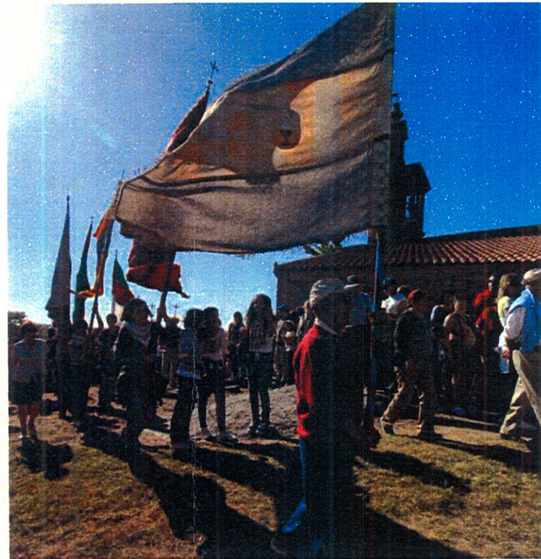
Romeros a la vera del cañón del Duero.